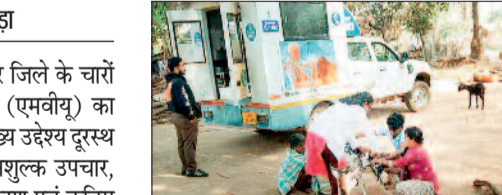
कुत्रिम गर्भाधान का कार्य कर रही है। साथ ही विभागीय योजनाओं की जानकारी, मौसमी टीकाकरण का प्रचार-प्रसार, पशुपालकों की संगोष्ठी एवं पशु चिकित्सा शिविरों का आयोजन भी किया जा रहा है।