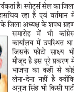
■ छवि धूमिल करने के लिये तरह-तरह की रच रहे साजिश